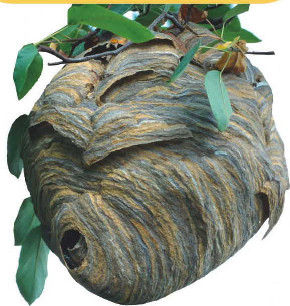
Frei hängende Nester im Innen- und Außenbereich werden in der Regel von nicht zudringlichen Arten bewohnt, wie hier von der Mittleren Wespe.