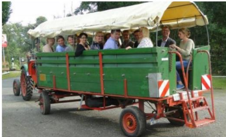
Bereisung der angemeldeten Dörfer durch die Bewertungskommission