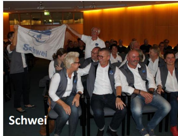
Abschlussveranstaltung und Siegerehrung im Kreishaus