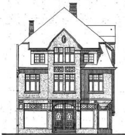
Karlstr. 12 („Presse“)